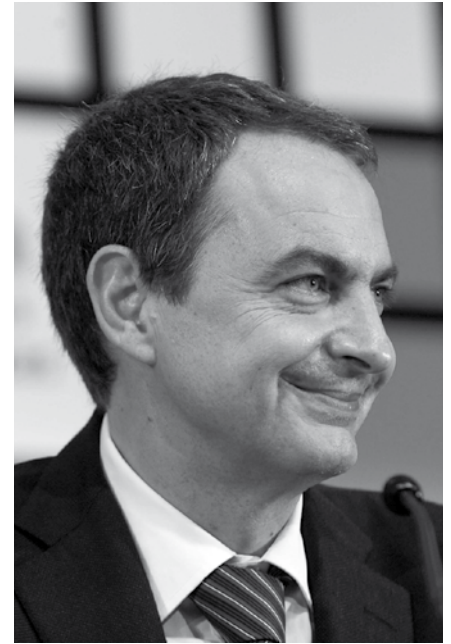
■ José Luis Rodríguez Zapatero.

El Gobierno de España invertirá cerca de 6 millones de euros en Águilas en 2009, para promover la realización de obra pública e inversiones generadoras de empleo, con el fin de contribuir a la reactivación económica del municipio.