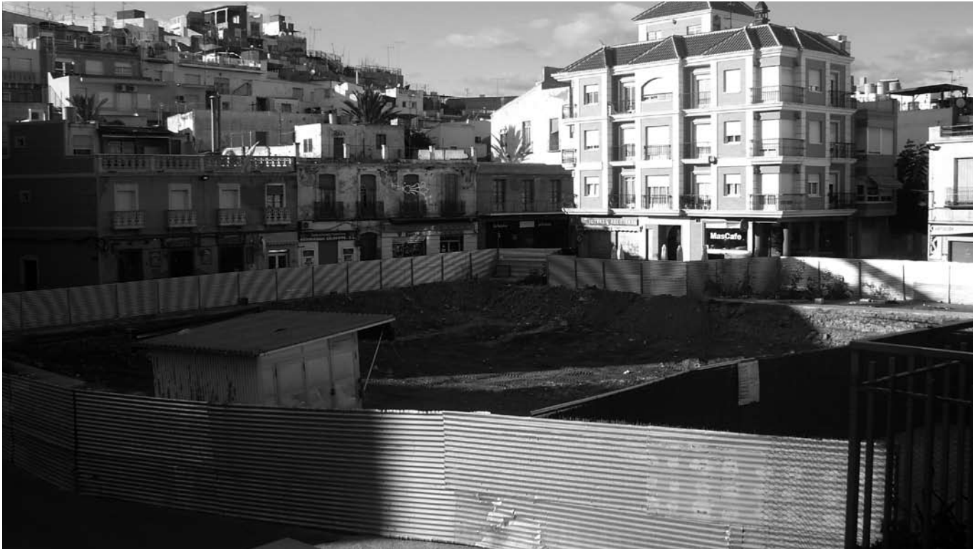
■ El aparcamiento del Placetón. Otra más, de las tantas promesas del Partido Popular, que se encuentra en estado de 'obra perpetua'.